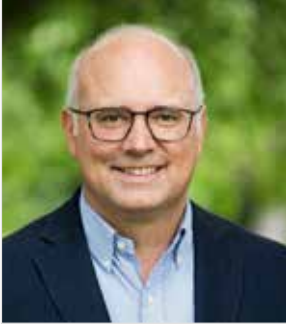
Jochen Weiler Bürgermeister