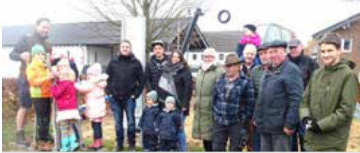
Unser Foto zeigt Mitglieder des Bürgervereins sowie Eltern und Kinder aus Vlatten bei der Einweihung der Spielgeräte.